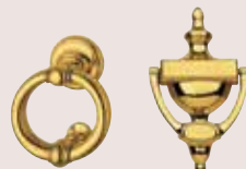
Heurtoirs laiton brillant