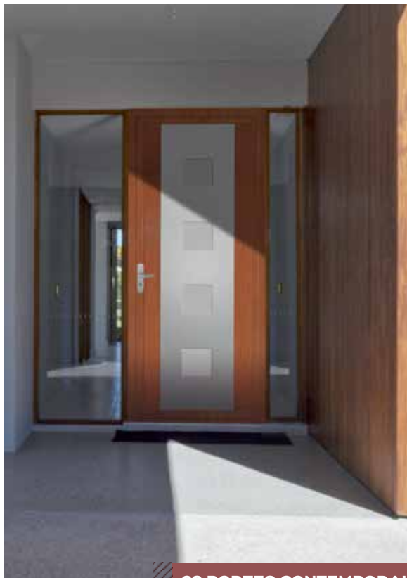
23 PORTES CONTEMPORAINES