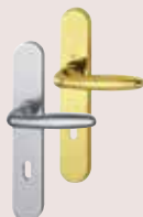
Éole aspect inox et laiton