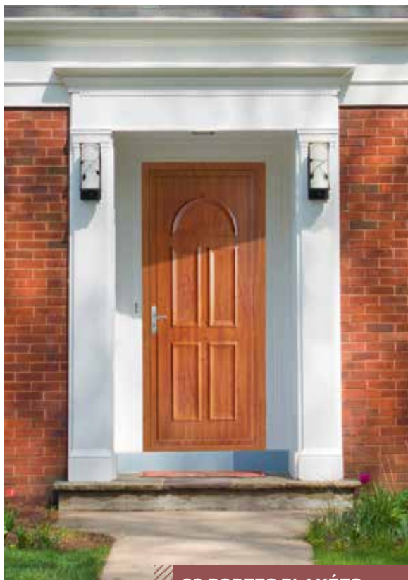
29 PORTES PLAXÉES