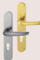
Bora aspect inox et laiton