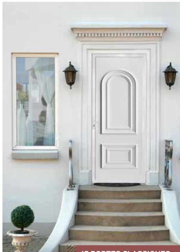
45 PORTES CLASSIQUES