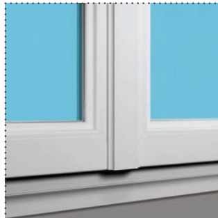
BATTEMENT INTÉRIEUR MOULURÉ de 112 mm sur les fenêtres pour un plus grand clair de jour