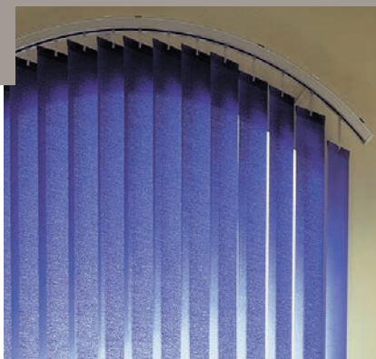
Un rail déclinable dans différentes formes et inclinaisons