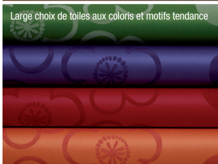
Large choix de toiles aux coloris et motifs tendance