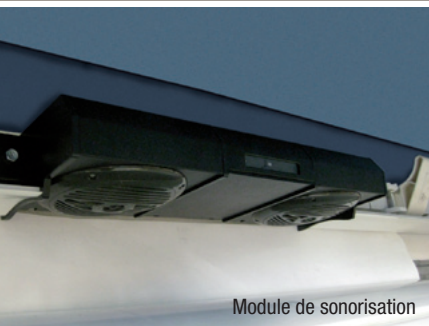
Module de sonorisation